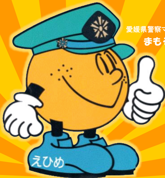
愛媛県警察マスコットキャラクター まもるくん