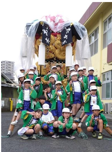
高木子ども太鼓台