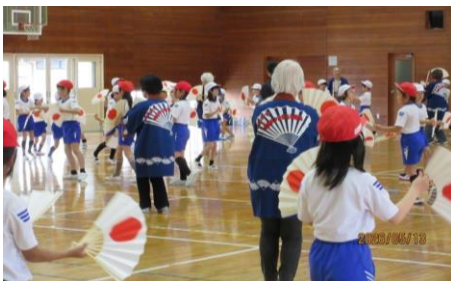
トンカカさん踊り 練習風景

金栄トンカカさん踊り保存会の皆様のご指導のもと、金栄小学校運動会に向けてトンカカさん踊りの練習を2日間行いました。5月13日(水)は小学3年生の練習。5月20(水)は3～6年生の練習でした。両手に扇子を持ち、真剣に取り組んでいました。金栄トンカカさん踊り保存会の皆さん、毎年ご指導ありがとうございます。