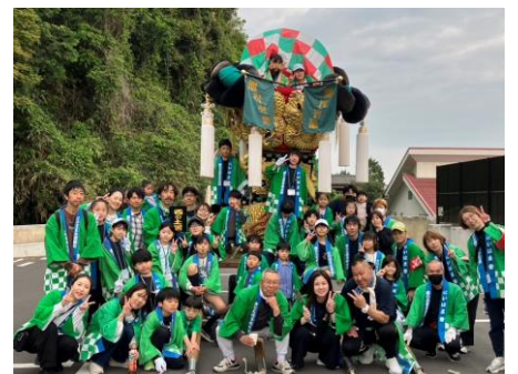
西の土居子ども太鼓台

5月3日(日)、駅前地区、高木地区、政枝地区、西の土居地区の子ども太鼓台が町内を練り歩きました。あいにくの雨模様でしたが、子どもたちは「そーりゃ。そーりゃ」と元気に声を出しながら運行していました。太鼓のお手伝いをされた方々、大変ご苦勞様でした。