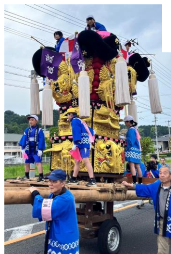
政枝子ども太鼓台