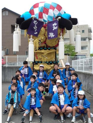
坂井(駅前)子ども太鼓台