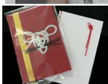
↑見本と見比べながらポチ袋づくり