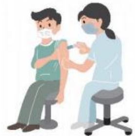
(厚生労働省資料より)