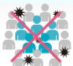
みっしゅう 密集した場所