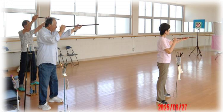
呼吸を整え、一気に矢を的めがけ放ちます。

現在約10名の会員で活動をされていますが、新たに会員も募集中とのこと。公民館まで連絡いただければお繋ぎします。