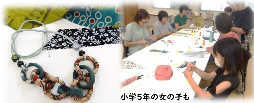
小学5年の女の子もとても上手にできました

参加者は「普段着にもおしゃれ着にも似合いそう」「軽量なので気軽に着けられる」と満足の出来栄でした。