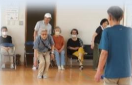
シニアポッチャ大会(6/25)

パラリンピックの正式種目になっていますが、障がいのあるなしだけでなく、全ての人と一緒に競い合えるスポーツです。