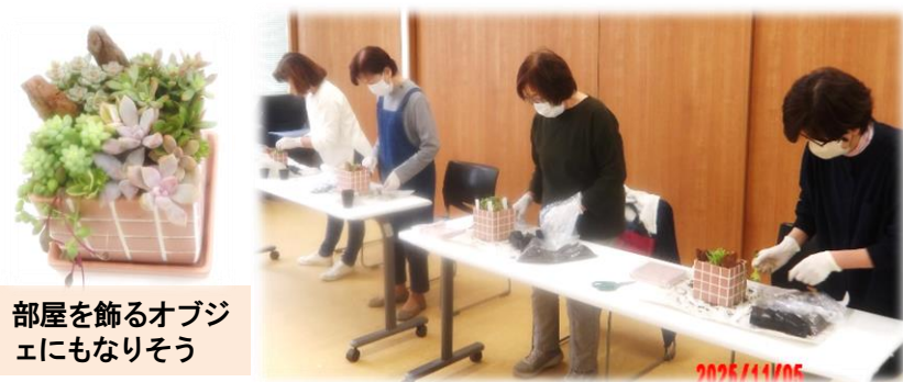
部屋を飾るオブジェにもなりそう