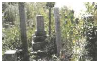
平兵衛の墓 又野2丁目