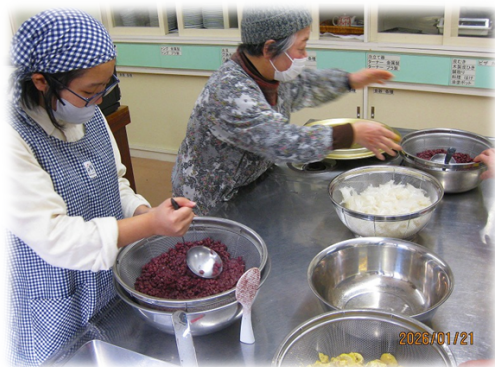
煮立った小豆をすり潰す

以前の館報で“ようかん作り”の歴史をひも解きご紹介しましたが、今回は、ようかんに含まれる効果や効能をご紹介したいと思います。