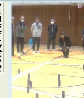
健康増進セミナー 校区ボッチャ大会、モルック大会を実施しました。