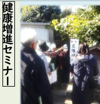
教養講座 男の料理教室、「まち歩き(史跡巡り)」を実施しました。