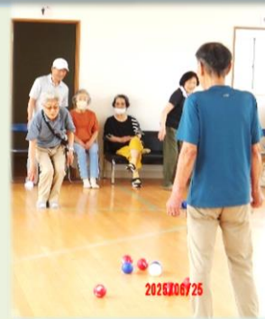
シニア生き生き講座 ボッチャ大会、腰痛ひざ痛体操、認知症予防教室等を実施