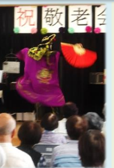
宮西校区敬老会 校区敬老会を開催！参加者は恒例のマジックショーやフラダンスを堪能されました。