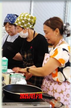
多国籍文化交流 「微笑みの国」タイの料理教室を実施しました。