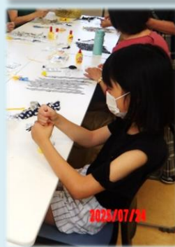
趣味の講座 藍染め、陶芸、ネックレス作り 寄せ植え教室を実施

令和7年度は、6月の「人権講演会」を皮切りに、様々な講座、また、まちづくり協議会の事業等を実施しました。その一部をご紹介します。講師の皆様、お手伝いいただいた方、そして参加していただいた皆さん、本当にありがとうございました。