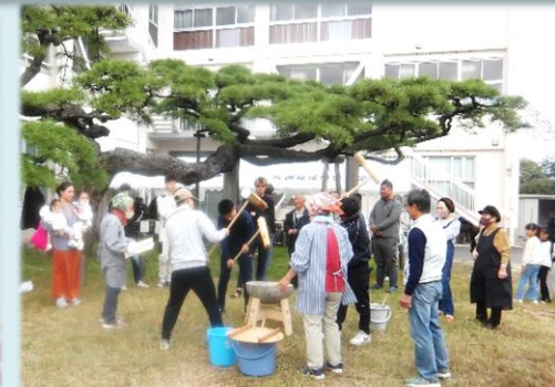
Autumn Festival in くちや、校区文化祭 は共に大盛況でした。