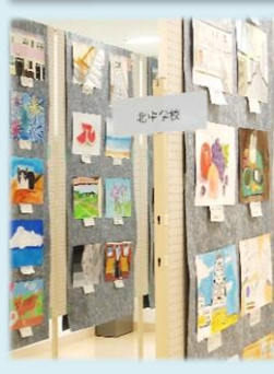
北中校区子ども 絵画展 開催