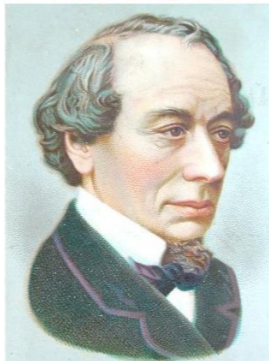
Disraeli https://ja.wikipedia.org/wiki/ベンジャミン・ディズレーリ

1874年、2人の男が「イギリス首相」の座をめぐる争って争っていました。テイズレーリの絵 自由党党首のウィリアム・グラッドストーンと保守党党首ベンジャミン・ディズレーリの二人です。一人目のグラッドストーンは、大金持ちの息子で、オックスフォード大学を首席で卒業した秀才です。二人目のディズレーリは、移民の家系で、若い頃は商売に手を出すものの破産に追い込まれるなど、波瀾万丈の末に政治家となった人物です。