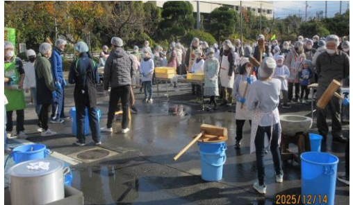
三世代交流もちつき大会