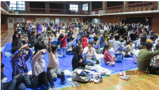
ウインターフェスト in そうびらき2025