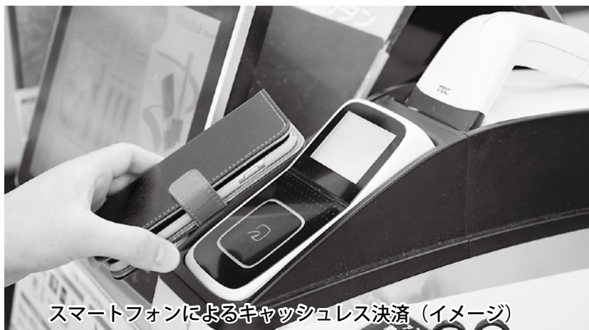
スマートフォンによるキャッシュレス決済（イメージ）

今回は『キャッシュレス決済』について基本的なことを簡単に説明します（決済サービスの種類は多様化・複雑化しており、分類などが明確でない場合があります）。