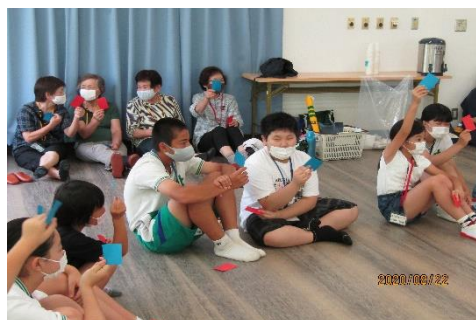
「クロスロードゲーム」