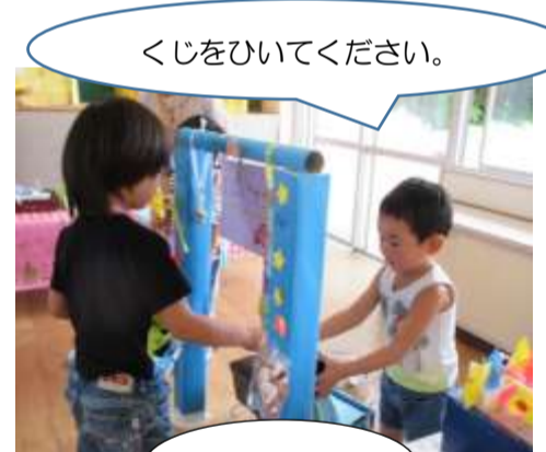
くじをひいてください。