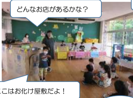
どんなお店があるかな？