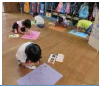
お店の看板をかいています！