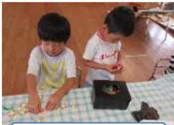
くじびきを作っているよ！