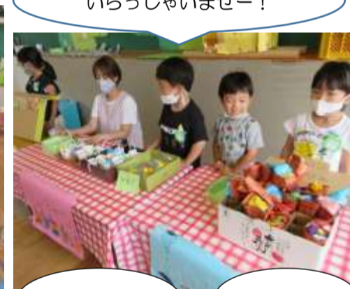
いらっしゃいませー！