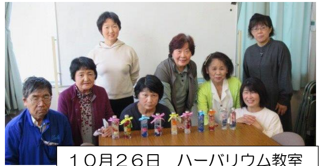
10月26日 ハーバリウム教室

8月13日から10月18日までコロナウイルス感染症対策のため公民館は利用停止となっていました。この間に予定していた講座は中止や延期となり、参加予定になっていた方々には大変ご迷惑をおかけしました。10月の停止解除以降に行った講座をご紹介します。