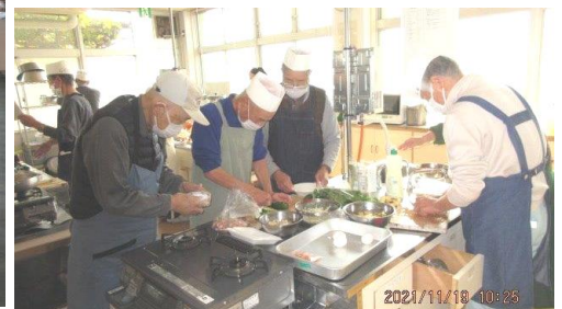
11月19日 男性料理教室